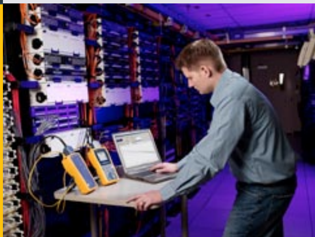
DTX-1800 mit DTX 10 Gig Kit zum Prüfen von Alien Crosstalk-Leistung

Erweitern Sie den Funktionsbereich Ihres DTX CableAnalyzer um Prüfoptionen für Koaxialverkabelungssysteme, z. B. ältere Datennetze (wie 10BASE-2 oder 10BASE-5 Ethernet) und Verbindungen zur Videoübertragung. Prüfen Sie die Kabellänge, Laufzeit und Eingangsimpedanz sowie die Einfügedämpfung in Abhängigkeit von der Signalfrequenz.